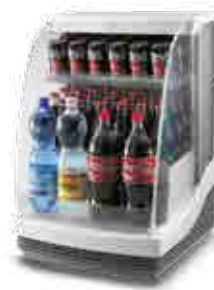
SAR-EC 447 E