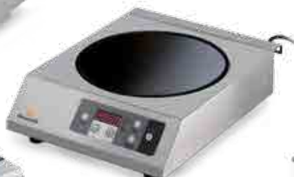
Misano 3,5 Wok