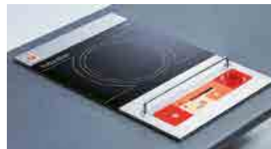
Imola 2,5 Incasso