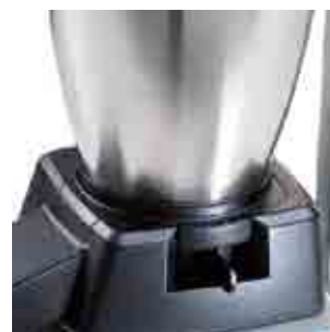
Regolazione dello spessore del ghiaccio Adjusting ice thickness