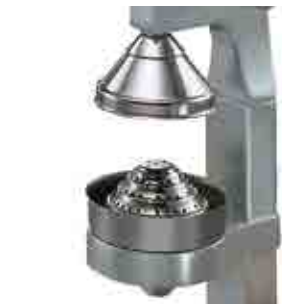
Spremiagrumi Citrus squeezer

Mantova Spremi agrumi manuale con pigna, imbuto e coperchio in acciaio inox 304. Corpo in lega di alluminio. Permette di spremere gli agrumi con una semplice pressione della leva.