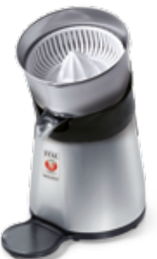
Lignano Big Corpo alluminio Aluminium body