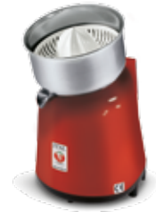
Lignano VV Rosso