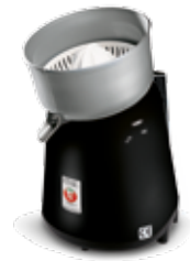
Lignano E Nero