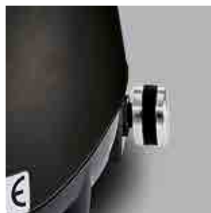
Variatore di velocità Variable speed device