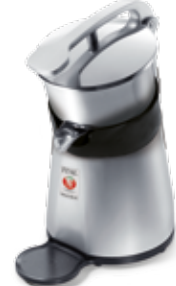
Misurina Big Corpo alluminio Aluminium body

Lignano - Misurina Spremi agrumi elettrico professionale dalle linee semplici e arrotondate. Studiata per garantire all'utilizzatore massima praticità ed affidabilità. La vaschetta di raccolta in acciaio inox e la pigna sono facilmente rimovibili e lavabili anche in lavastoviglie. La serie automatica A, dispone dell'esclusivo microinterruttore su pigna che permette l'azionamento della macchina premendo sull'agrume. Coperchio antipolvere optional su modelli con vaschetta inox. Disponibile anche con variatore di velocità e, nella serie economica, con vaschetta in ABS alimentare.