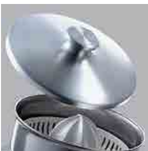
Coperchio optional Optional cover

Di serie su linea Big Standard on Big models