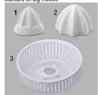
Pigna limoni (1); pigna arance (2); setaccio statico (3) Lemon cone (1); orange cone (2); removable sieve (3)