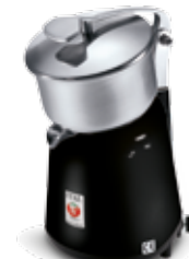
Misurina VV Nero