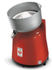
Lignano E Rosso