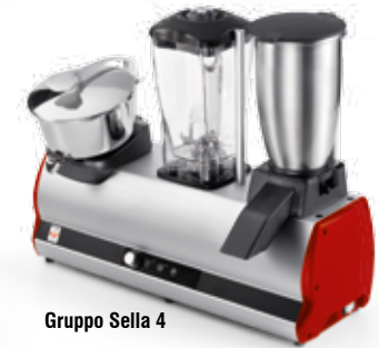
Gruppo Sella 4