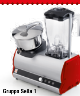
Gruppo Sella 1

ASOLO ICE = blender with square glass MISURINA = citrus juicers with lever MARMOLADA = ice crushers JESOLO = drink mixers