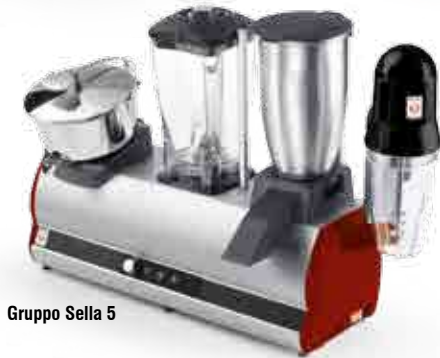
Gruppo Sella 5