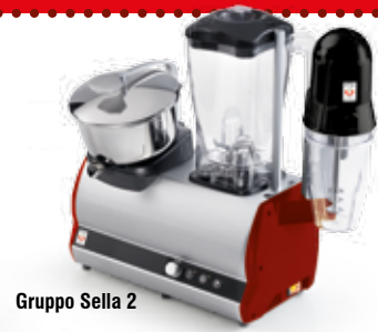
Gruppo Sella 2