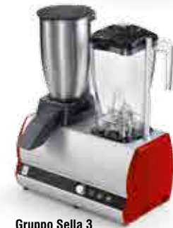
Gruppo Sella 3